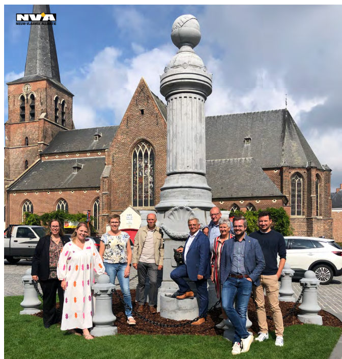
Foto: Na jarenlang ijveren door de N-VA-fractie is de renovatie van de pomp een feit. Ze staat opnieuw te blinken op de markt.