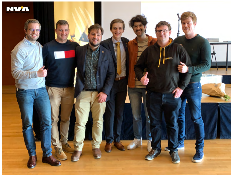
Foto: Onze jongeren samen met de vorige en huidige voorzitter van Jong N-VA nationaal tijdens het vormingsweekend eerder dit jaar.