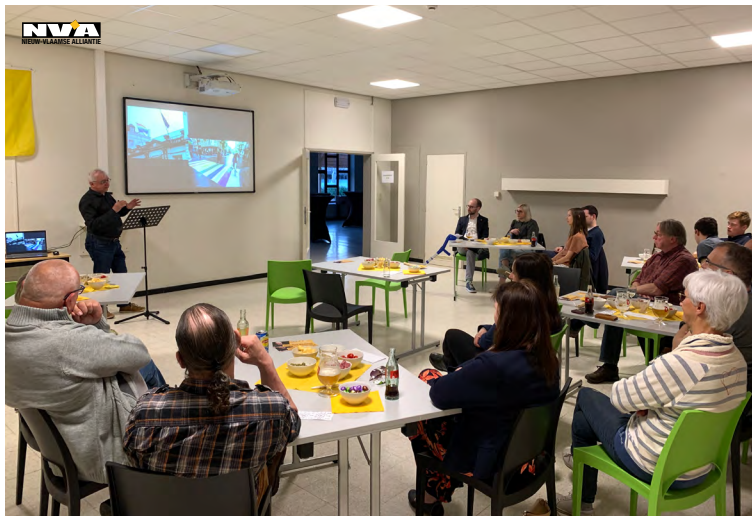
Foto: Johan Sanctorum trakteerde ons op een interessante uiteenzetting over humor en satire in woke-tijden.

'Terug naar Malpertus', de thuishaven van de vos Reynaert in het middeleeuwse epos, is een radicaal verzet tegen de nieuwe