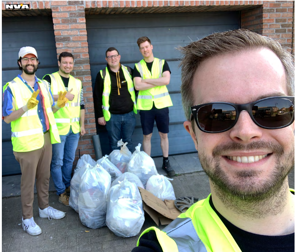
Foto's: Jong N-VA Dessel hielp mee aan de lenteschoonmaak in de Desselse straten en ze moesten er letterlijk hun handen en voeten voor vuil maken.