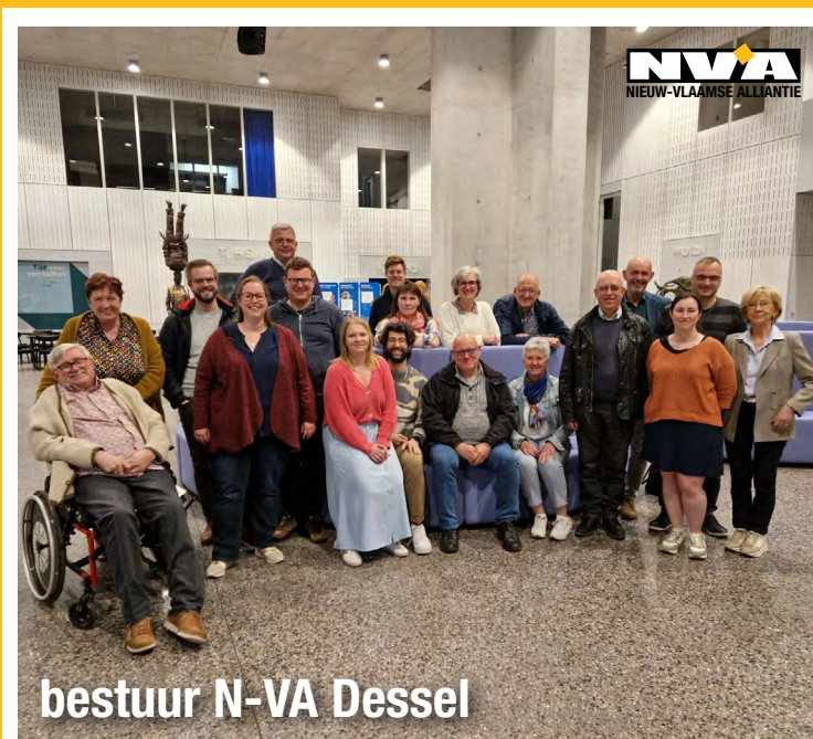
bestuur N-VA Dessel