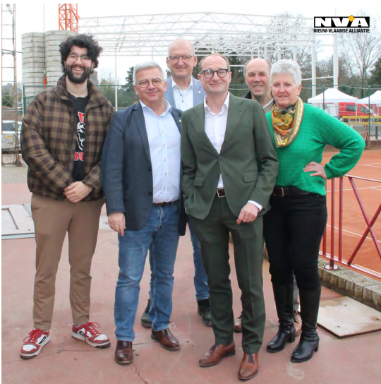
Foto: Enkele schepenen en raadsleden waren in het goede gezelschap van minister Ben Weyts aanwezig bij de eerstesteenlegging van de gymhal.