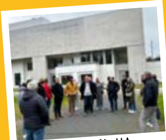
Jong N-VA bezoekt Tablooo