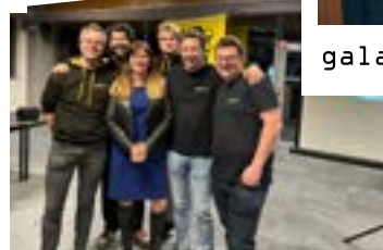
de Slimste Leeuw 2023