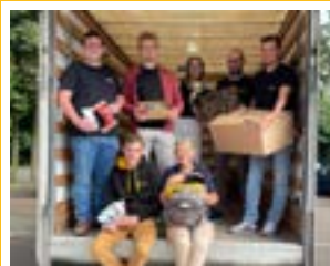
inzamelactie MIN Mol