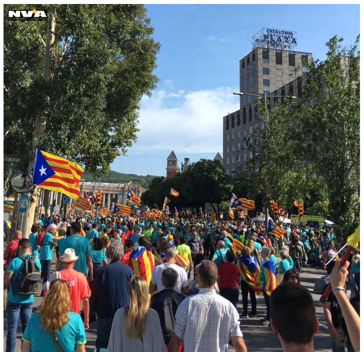
Foto: In 2019 reisden enkele van onze jongeren af naar Barcelona om de Diada (= Catalaanse feestdag) mee te vieren. Het was een indrukwekkend moment.