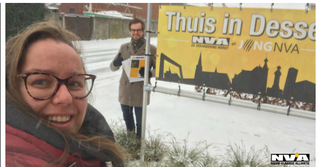
Foto: Barbara en Pieter-Jan zorgen sinds 2017 voor de opmaak van jouw Betrokkenheid en andere media.