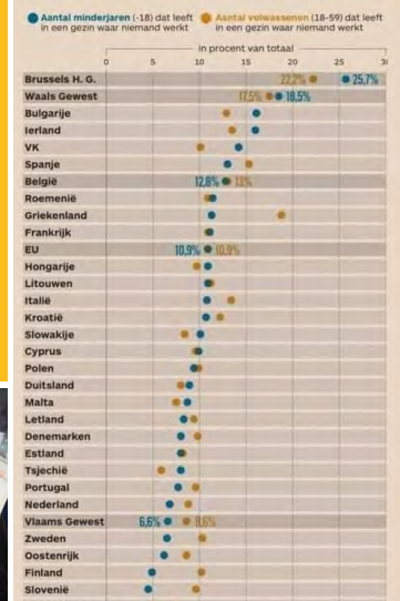
Een op de vier Brusselse en een op de vijf Waalse kinderen groeien op in een gezin waar niemand werkt. In Europa is het probleem van werkloze gezinnen nergens zo groot, zelfs niet in Griekenland of Spanje. Bij de volwassenen is eenzelfde tendens merkbaar.

De transfers van Vlaanderen naar Wallonië overschrijden in 2021 opnieuw de grens van 7 miljard euro. De komende jaren zullen ze verder oplopen.