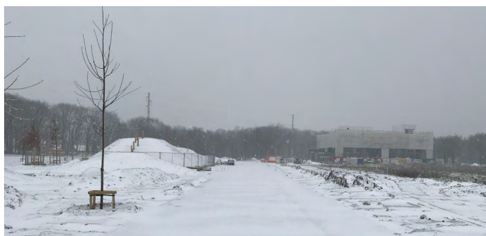
Foto: De bouwwerken van Tabloo zijn al aardig opgeschoten. Ook het landschapspark met speelheuvelds krijgt stilaan vorm.