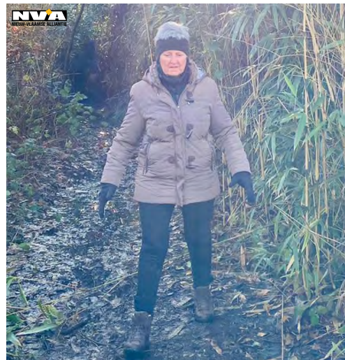
Foto: Anita geniet tijdens de coronaperiode van een wandeling in de natuur.

Het plan van de gemeente, in nauw overleg en overeenstemming met het bestuur van JG Scharnier, was om de Scharnier pal voor het parochiecentrum op te trekken, op de plaats waar op de authentieke plannen van het Parochiecentrum een café voorzien was.