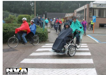
Foto: Zelfs wat regen kon de tandemfietzers niet tegenhouden.