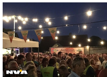
Foto: Sferbeeld van een hartverwarmende Samathon.