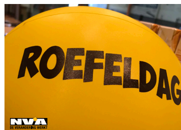
Foto: Na het optreden van Blitz op Dessel Swingt kregen alle Roefelaars een mooie strandbal.