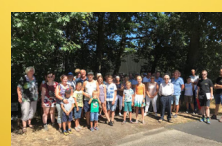
Toerist in eigen dorp