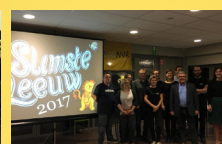
Quiz De Slimste Leeuw