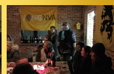
Rond de vuurkorf