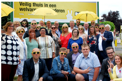
Foto: Al onze kandidaten, helpers, vrijwilligers verdienen een pluim na een succesvolle campagne.

Tenslotte worden enkelen van die verkozenen aangeduid om verantwoordelijkheid te nemen als burgemeester en schepenen. Dat nog kleinere groepje heeft ook alles te danken aan die groep. Daarom zetten we onze hele ploeg in de kijker. Zij haalden de 51,50 %!