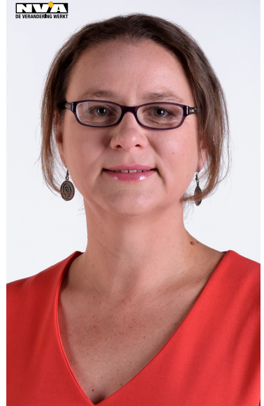
Foto: Ellen is voorzitter van het Uitvoerend Comité van het Lokaal Fonds.

Binnen de Desselse politieke werking heeft Ellen een bijzondere aandacht voor het Lokaal Fonds dat opgericht werd als één van de STORA-voorwaarden voor de berging van het categorie A-afval. Ze is voorzitter van het Uitvoerend Comité, het orgaan dat jaarlijks de projecten goedkeurt die vanuit het Lokaal Fonds kunnen gesubsidieerd worden. Nu nog een beperkt budget, maar op kruissnelheid moet dit Lokaal Fonds voor een echte meerwaarde zorgen. Met de gedrevenheid en nuchterheid die Ellen kenmerken, is het voorzitterschap alvast in stevige handen.