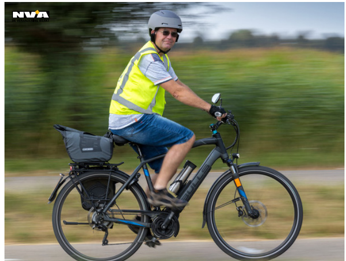
Foto: Een man op een speedpedelec mét helm en fluovest.

Denk eraan dat je snel bent en andere weggebruikers je daarom niet of laattijdig zien aankomen of dat automobilisten de afstand tot jou verkeerdelijk inschatten. Wees op je hoede, rijd defensief en zorg dat je gezien bent. Licht op en fluohesje aan. Waarom niet?