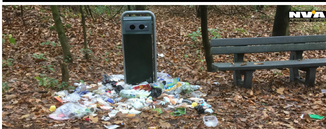
Foto: Deze foto werd bezorgd met de boodschap: "Juist opgemerkt in de Wittebergenstraat en iets verderop nog twee vuilniszakken."

De vzw STORA bestaat uit drie geledingen: vertegenwoordigers van het economisch leven in Dessel, van de gemeentelijke adviesraden en van de gemeenteraad.