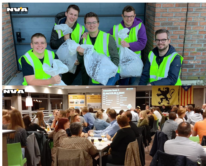
Foto's: 26 oktober was een drukke dag voor onze jongeren: in de voormiddag trokken ze ten strijde tegen het zwerfvuil en 's avonds zochten ze de Slimste Leeuw.