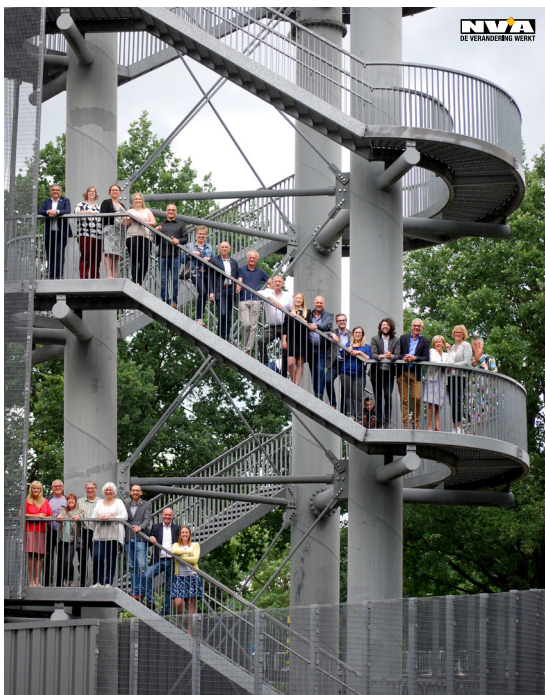
Foto: Ons bestuur op de trappen van de Sas4-toren, één van de 'gebouwen' waar lokaal bestuur Dessel de trotse eigenaar van is.

sportzaal in Witgoor. Gevolgd door een uitbreiding van Sportpark Brasel, met een andere invulling voor de kleuterscholen van de Heide en Brasel. Ook de lokalen voor de technische diensten aan de Hofstraat en Kerkhofweg werden opgetrokken of uitgebreid aan de Pluimstraat. En tot slot de bouw van een nieuwe school in Dessel en kinderopvang de Speelplaneet. Maar we bouwden niet voor ons alleen. We kwamen met riant subsidies over de brug zodat nieuwe Chirogebouwen konden opgetrokken worden in Witgoor, de voetballende jeugd in Brasel een nieuw complex kon betrekken en Witgoor Sport het Wouwerpark kon realiseren. Verenigingen dopten vroeger zelf hun boontjes... Het waren 'andere' tijden. Het is een langgerekte evolutie want vroeger deden de gemeenten dat helemaal niet. En dan spreek ik nog niet van wegen en voet- en fietspaden waarvan verwacht wordt dat ze er als biljarttafels bijliggen. Alles in ogenschouw genomen, werken we daar met fierheid aan want samen maken we Dessel nog mooier.