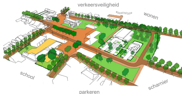
Afbeelding: 3D-tekening van de voorgestelde plannen. Bron: gemeente Dessel