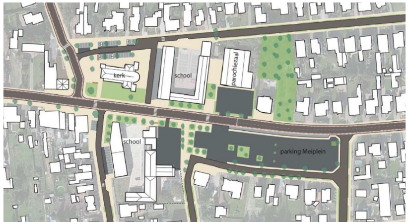
Afbeelding: bovenaanzicht huidige situatie.