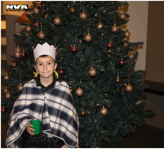
Foto: Robrecht was één van de zangertjes die op Driekoningen kwam smullen van een lekkere wafel en warme chocomelk.