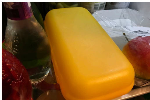
Foto: In de gele doos*, die in de koelkast bewaard wordt, zitten belangrijke medische gegevens. Aangezien iedereen een ijskast heeft, is dit de ideale plek.