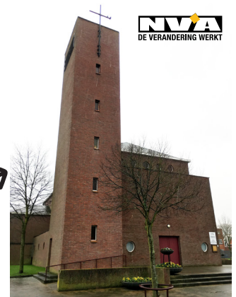
Kerk van de H. Familie