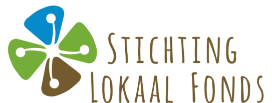
Foto: Logo Stichting Lokaal Fonds.