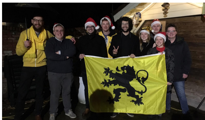
Foto: Het nieuwe bestuur van Jong N-VA Dessel. Elia ontbreekt op de foto.