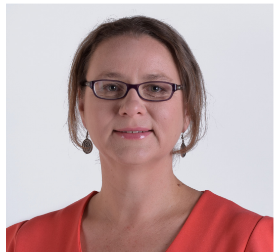
Foto: Ellen Broeckx is voorzitter van het Uitvoerend Comité Dessel van het Lokaal Fonds.