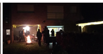
Foto: Sfeerbeeld Rond de vuurkorf