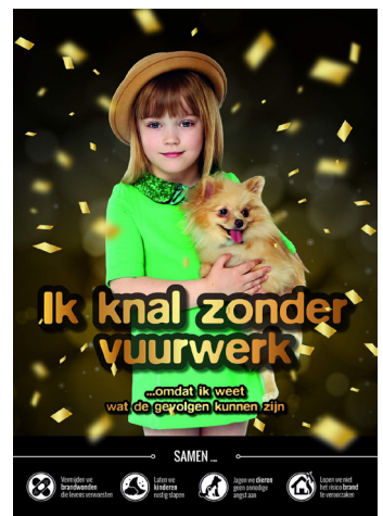
Foto's: Deze 4 posters roepen op om tijdens oudjaar te feesten zonder vuurwerk.