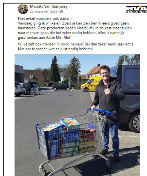
Foto: Maurits voegde de daad bij het woord en schonk voedsel aan Actie MIN.

Onlangs brachten we met N-VA Dessel een bezoekje aan Actie MIN (Actie Mensen In Nood) in Mol. We leerden de vrijwilligers en de werking van Actie MIN beter kennen. Actie MIN fungeert als ontmoetingsplaats voor zij die het niet breed hebben en waar ze kunnen genieten van een tasje thee of koffie en een babbeltje slaan. Daarnaast is er ook een voedselbank waar producten kunnen worden aangekocht tegen een voordelig tarief. Ook Desselaars brengen Actie MIN frequent een bezoek. Actie MIN zet zich in het algemeen belangeloos in voor zij die het niet breed hebben. Tijdens het babbelen met de vrijwilligers van Actie MIN kwam duidelijk aan het licht dat deze prachtige organisatie op zoek is naar vrijwilligers. Daarom dat we graag helpen met de zoektocht naar deze vrijwilligers. Zoek jij nog een zinvolle invulling van je vrije tijd en spreekt Actie MIN je aan? Neem dan zeker contact met hen op via 0473 24 13 61 of actiemenseninnood@gmail.com en meld je aan als vrijwilliger. Ook in deze tijden van Corona is Actie MIN trouwens blij met elke bijdrage.