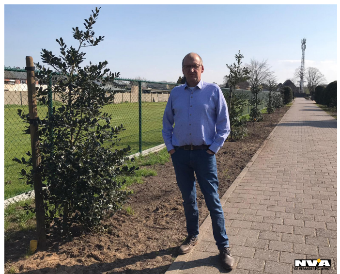
Foto: Langs de dreef richting het kerkhof van Dessel centrum werden nieuwe hulsten geplant.