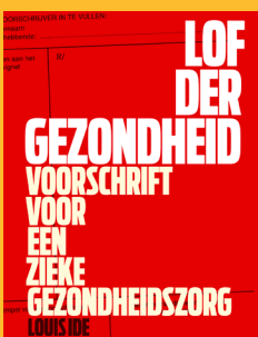
Louis Ide: Lof der gezondheid