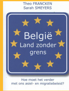
Theo Francken en Sarah Smeyers: België, land zonder grens