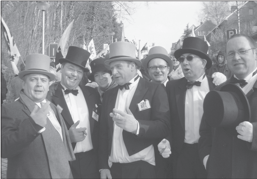
N-VA parlementsleden steken de draak met de Franstalige bourgeoisie in de Vlaamse rand. (Linkebeek, 6 maart II.)