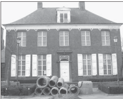
De pastorij blijft verder staan verkommeren...

paar jaar sneller te klein dan wel te groot te zijn, terwijl zien sporten ook doet sporten. Het vertrouwen vanwege onze gemeentebestuurders in de overigens zelf door de sportclubs verkozen sportraad is zo groot dat men achter haar rug de Desselse volleybal-, basketbal-, minivoetbal- en badmintonclub uitnodigde voor een onderhoud. "Divide et impera". Verdeel en heers, daarop bouwden de Romeinen 2.000 jaar geleden hun macht. Ook die was vergankelijk.