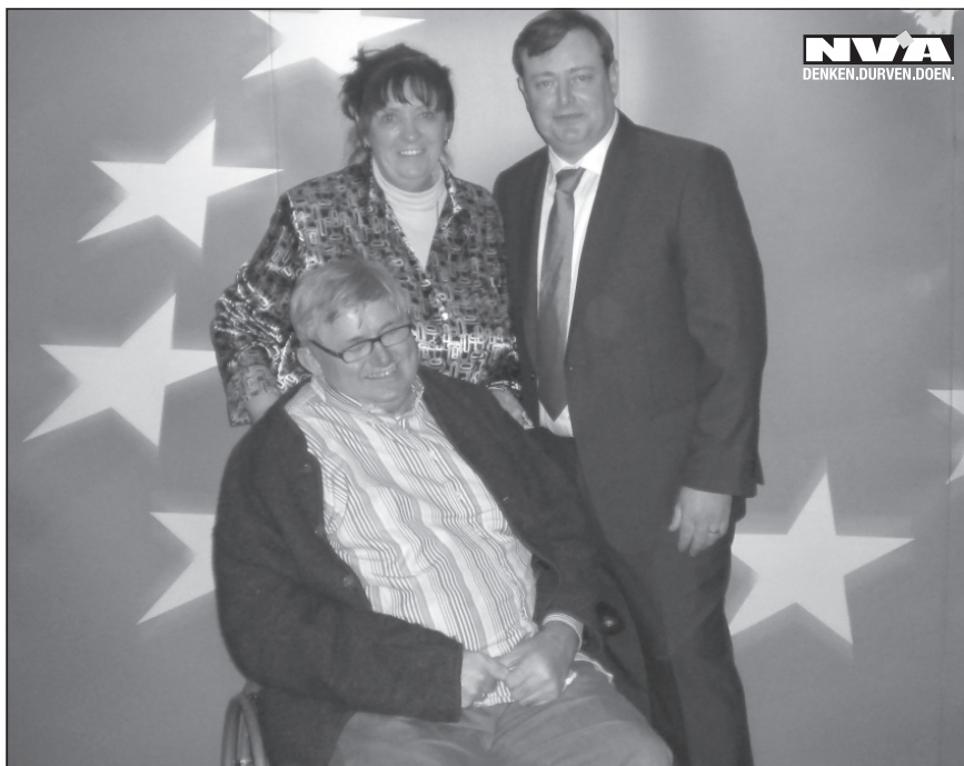
Met een hele bus trokken we vanuit Dessel naar de N-VA nieuwjaarsreceptie in Gent.