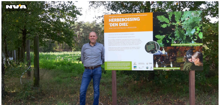
Foto: Schepen van Milieu, Willy Broeckx, geeft met plezier 500 bomen weg.

Digidak? Een project van Blenders vzw in het buurthuis in onze Braselwijk waarbij mensen met computer leren werken en hun creativiteit kunnen botvieren.