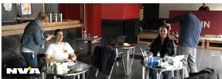
Foto's: Tijdens de opmeetdagen passeerden 142 Desselaars in JC Spin of JG Scharnier. De succesvolle actie zorgt zo voor 284 beschermde oren.