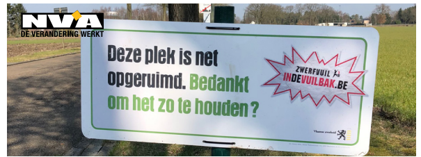
Foto: Jong N-VA Dessel is één van de verenigingen uit Dessel die mee de strijd tegen het zwerfvuil aangaat.